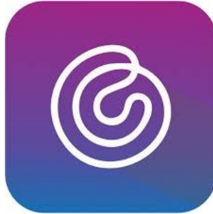
Gambar 1. 1 Logo PT. CAZH Teknologi Inovasi

CAZH adalah perusahaan rintisan (Startup) di bidang digital dengan menyediakan layanan aplikasi kasir mobile berbasis online untuk pelaku usaha di sektor perdagangan, jasa maupun industri.