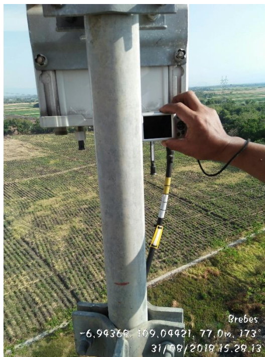
Gambar 2. Proses mengubah electrical tilt antenna sektoral