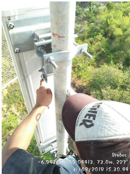
Gambar 1. Proses mengubah mechanical tilt antenna sektoral