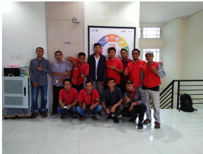
Gambar 4. Team PT. Telkomsel Tegal (RTPO Tegal)