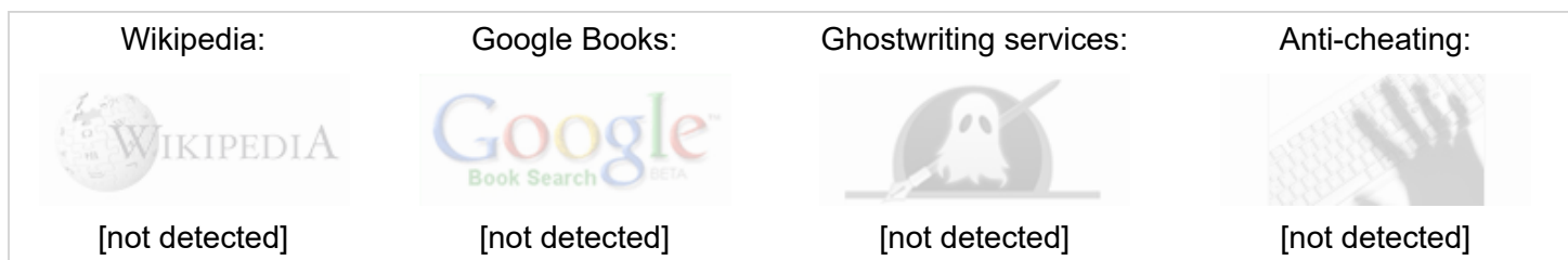
Active References (Urls Extracted from the Document):