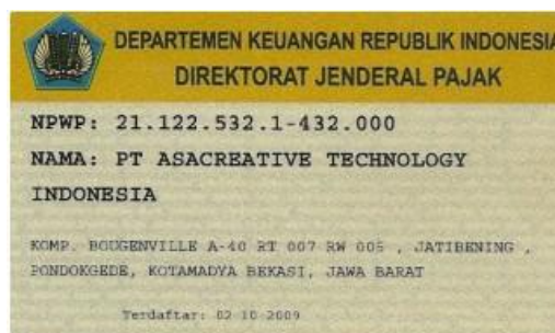
Gambar 1.2. NPWP PT. Asacreative Technology Indonesia