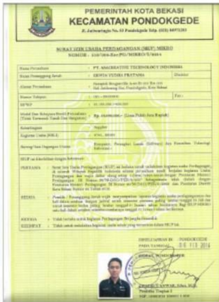
Gambar 1.1. SIUP PT. Asacreative Technology Indonesia