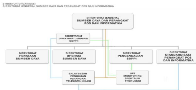
Gambar 1.2. Struktur Organisasi Direktorat Jendral Sumber Daya Dan Perangkat Pos Dan Informatika (SDPPI)