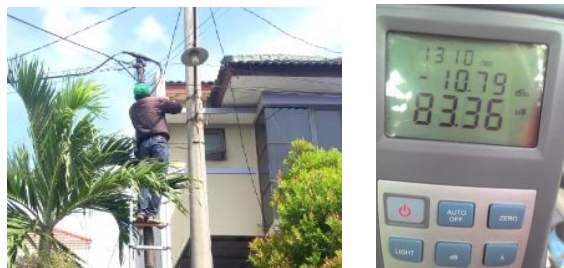
Pengukuran besar daya redaman pada ODP dengan menggunakan OPM