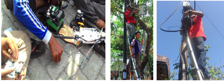
Penyambungan kabel Fiber Optik dengan splicer