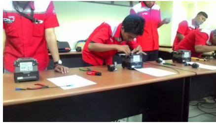
Pelatihan Splicing dengan splicer ilsyntec dan sumitomo