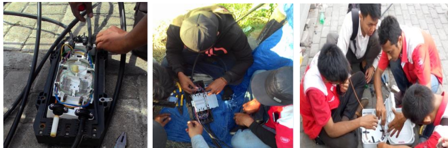
Membuka ODP dan melepaskan kabel fiber optik untuk penyambungan