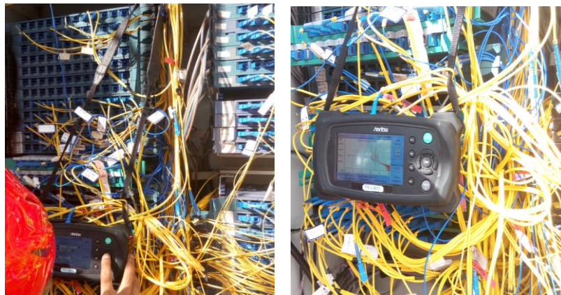
Pengukuran jarak loss sambungan dengan OTDR pada ODC-B