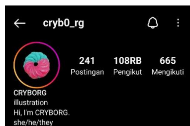
Gambar 2. 3 Karya cryb0_rg