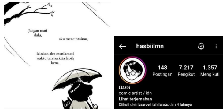
Gambar 2. 1 Karya Hasbiilmn