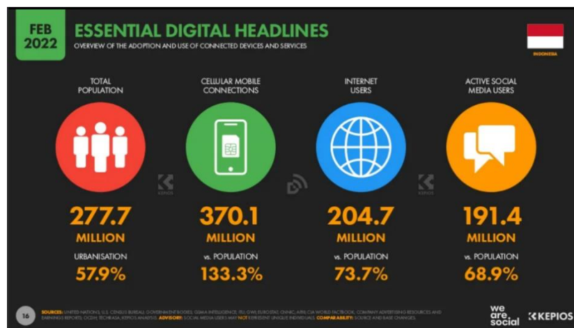
Gambar 1. 1 Jumlah Pengguna Internet dan Sosial Media di Indonesia[5]

Trend perkembangan transaksi digital bertumbuh pesat beberapa tahun terakhir seperti dilansir dari data yang didapat WeAreSocial di tahun 2022, yang mencapai angka 191,4 Juta pengguna yang merupakan 68,9% dari total penduduk di Indonesia yang berjumlah 277,7 Juta Jiwa[5].