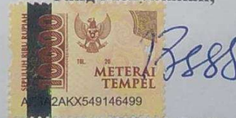
Mateus Paskah Purba