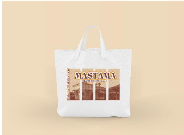
Gambar 5. 3 Visualisasi Totebag Depan