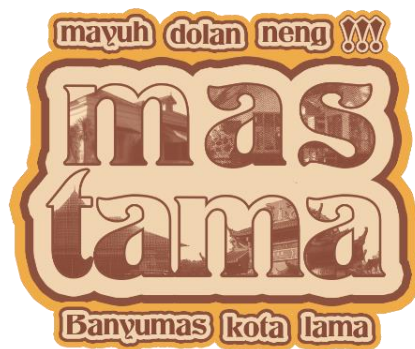
Gambar 5. 5 visual Keychain