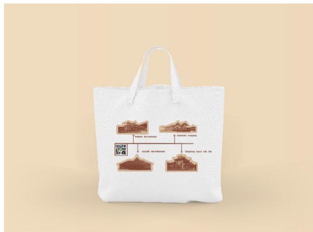
Gambar 5. 4 Visualisasi Totebag Belakang