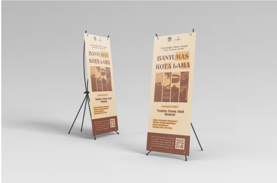
Gambar 5. 8 Visualisasi X Banner