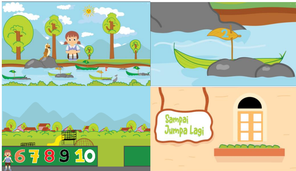
Gambar 5.2 Animasi Huruf dan Angka Perframe