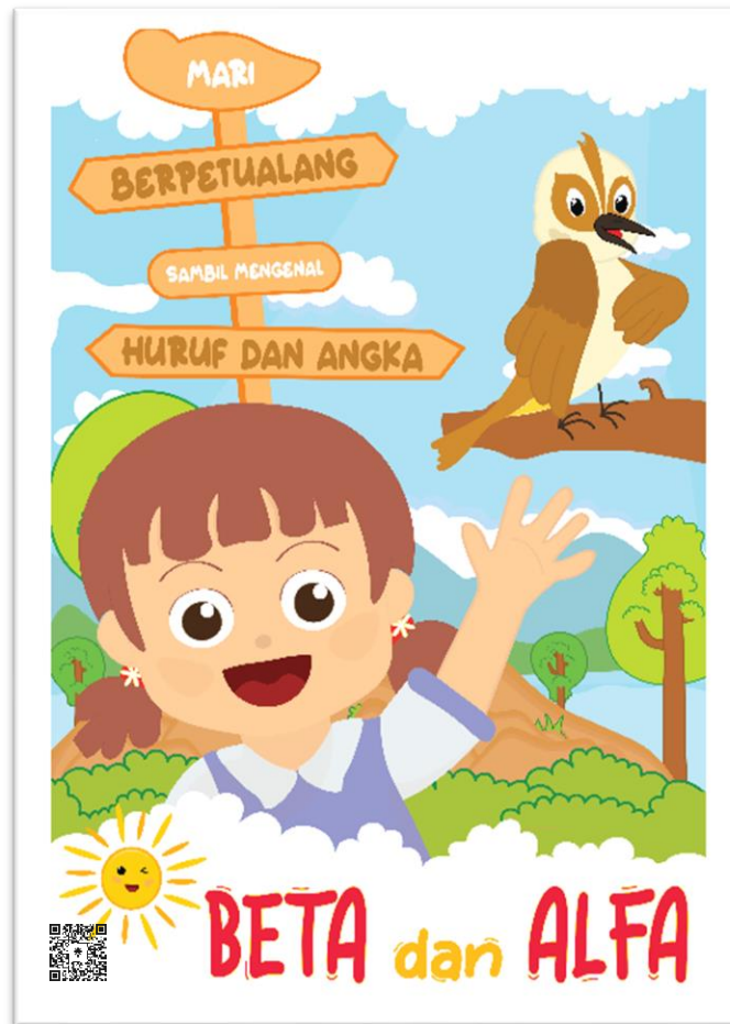
Gambar 5.6 Desain Poster