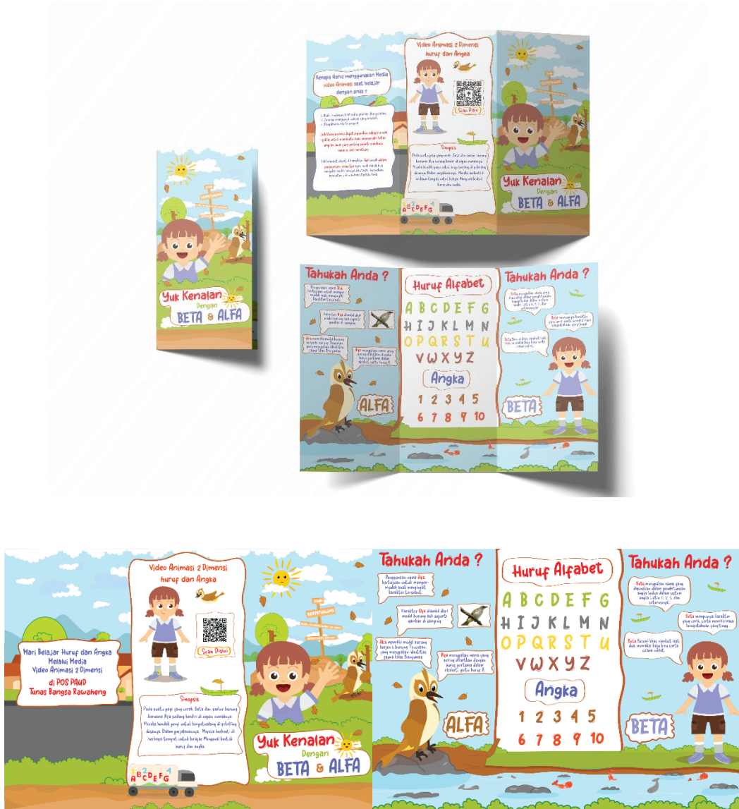
Gambar 5.7 leaflet