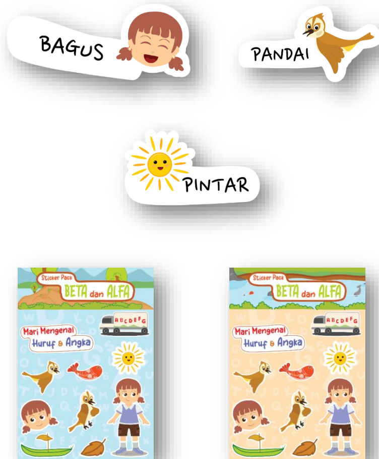
Gambar 5.5 Sticker

Media : Cetak Bahan : kertas Chromo kisscut Visualisasi karya : Adobe Illustrator