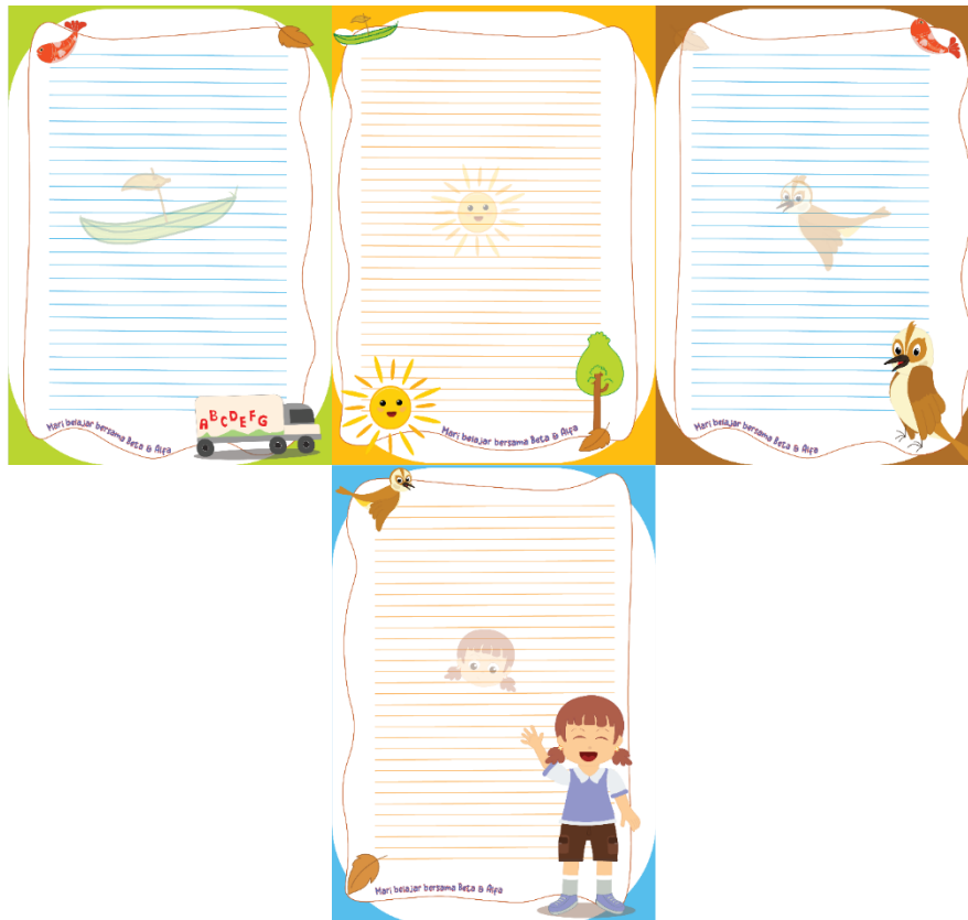
Gambar 5.4 Desain Buku Bergambar

Ukuran buku : 14,8 cm x 21 cm (A5) Media : Cetak Bahan : Hvs 150, Cover Vinyl Glossy Laminasi Visualisasi karya : Adobe Illustrator