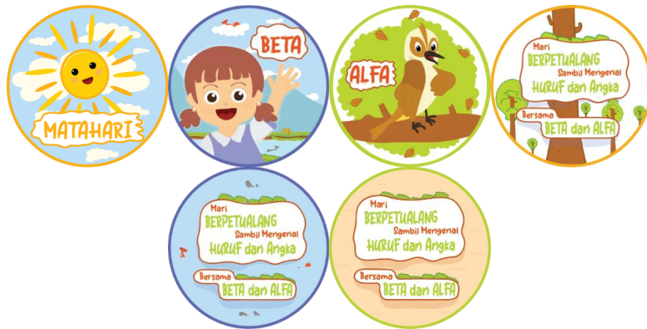
Gambar 5.3 Gantungan Kunci