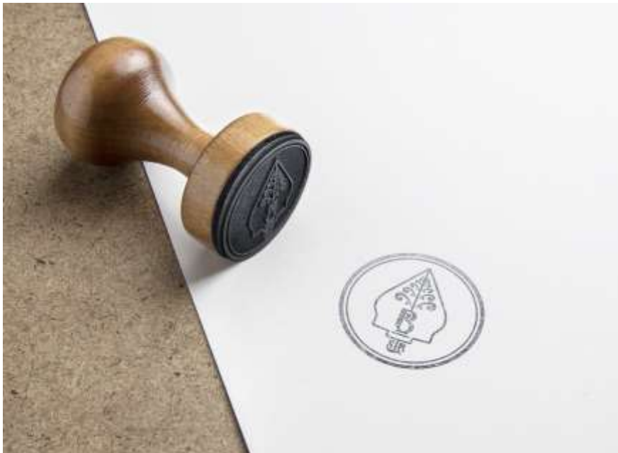
Gambar 5. 8 Stempel Sanggar Tari Bontot Basuki Sumber. Data diolah penulis 2023