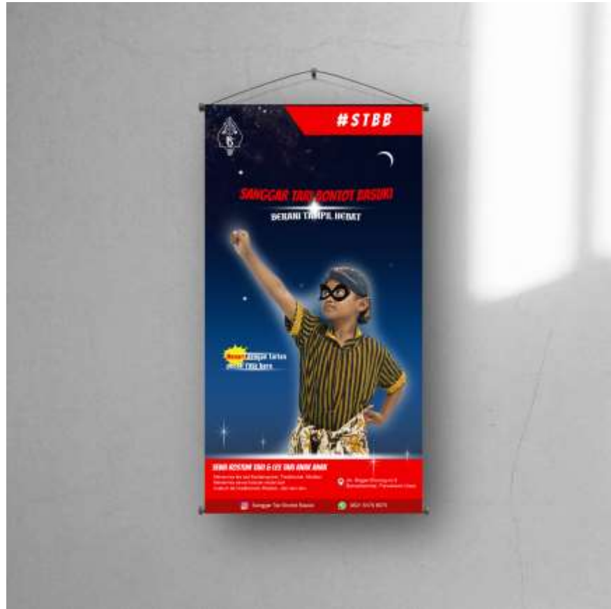
Gambar 5. 4 Hanging banner Sanggar Tari Bontot Basuki