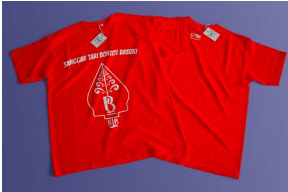
Gambar 5. 9 Kaos Sanggar Tari Bontot Basuki