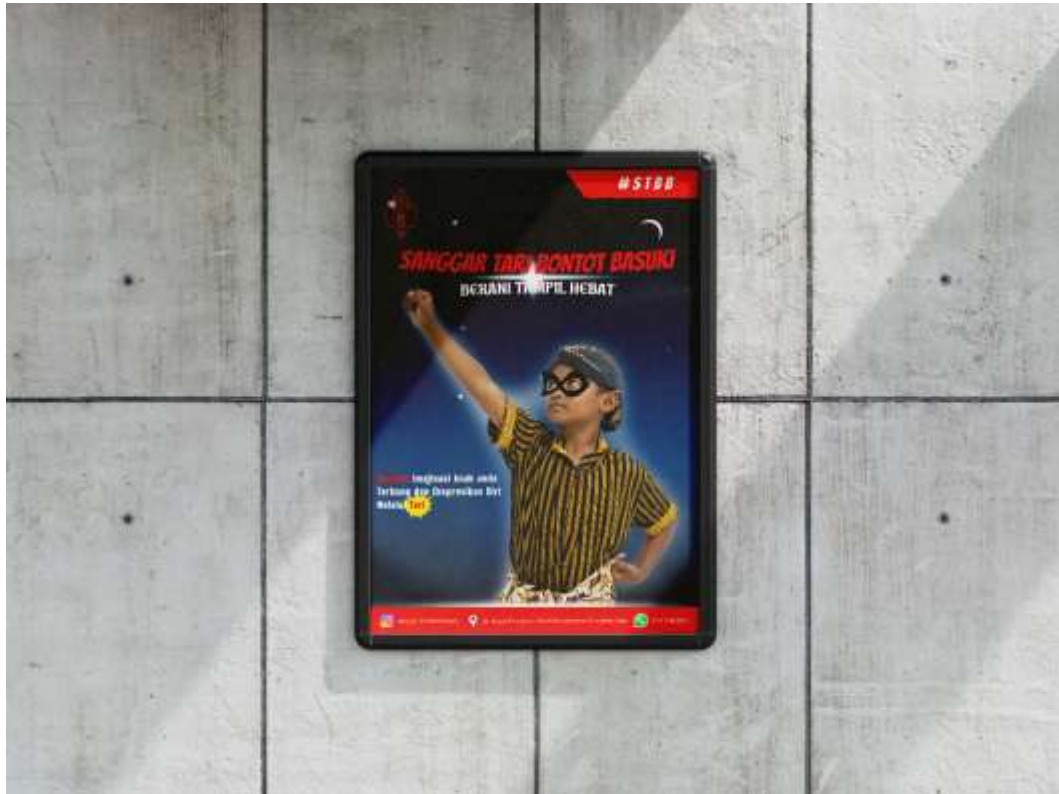
Gambar 5. 3 Desain Poster Sanggar Tari Bontot Basuki