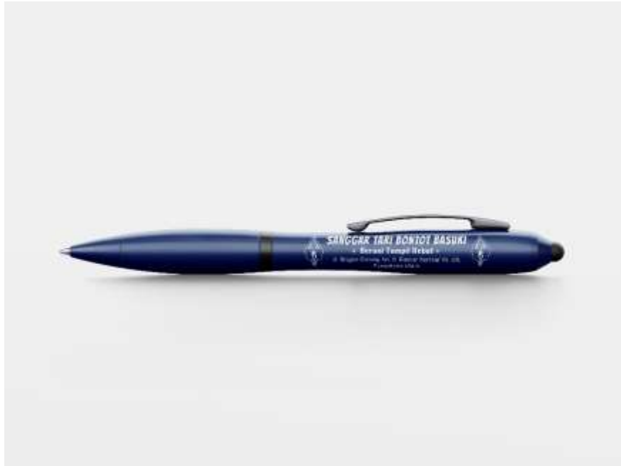
Gambar 5. 7 Desain Pulpen Sanggar Tari Bontot Basuki