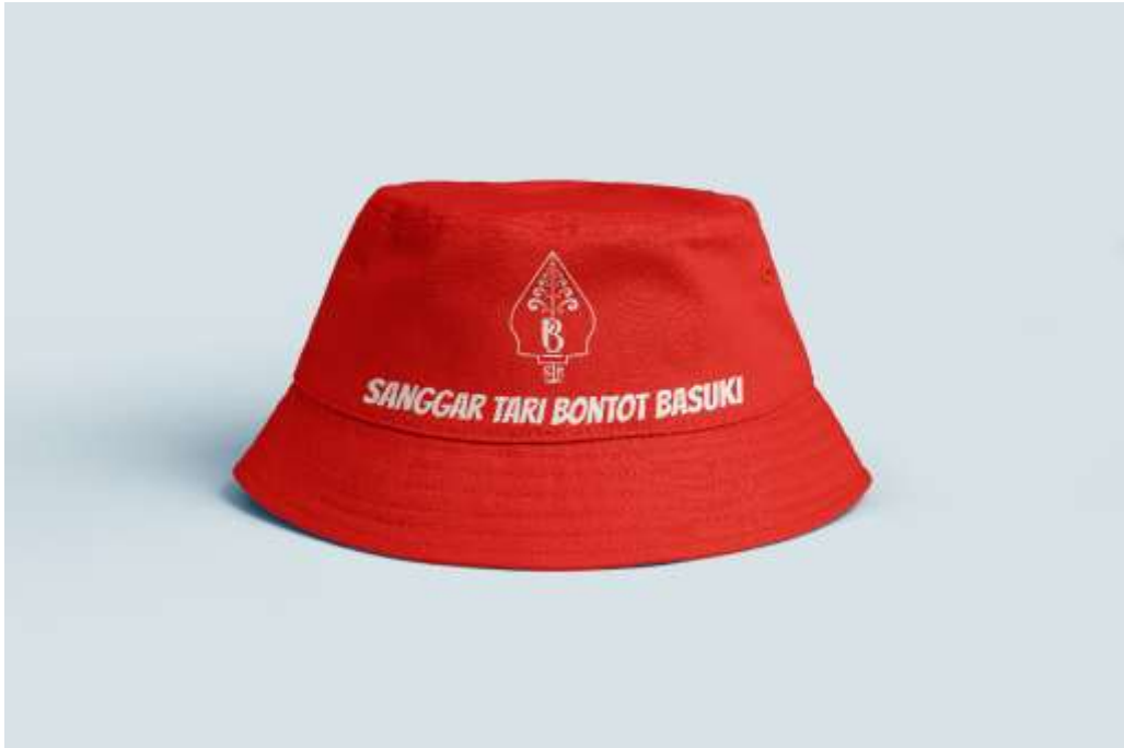
Gambar 5. 10 Topi Sanggar Tari Bontot Basuki Sumber. Data diolah penulis 2023