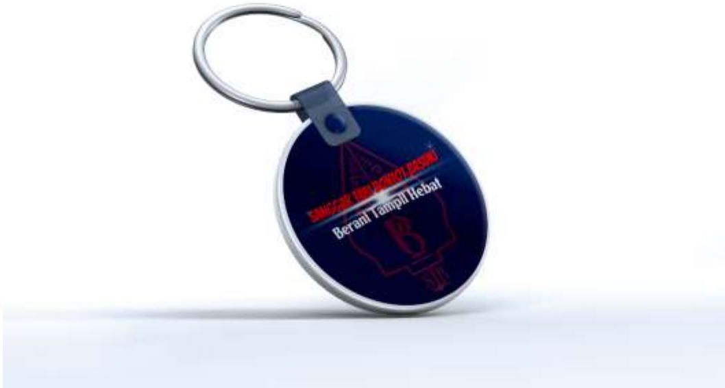
Gambar 5. 6 Desain Gantungan Kunci Sanggar Tari Bontot Basuki