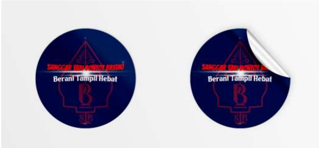
Gambar 5. 5 Desain stiker Sanggar Tari Bontot Basuki