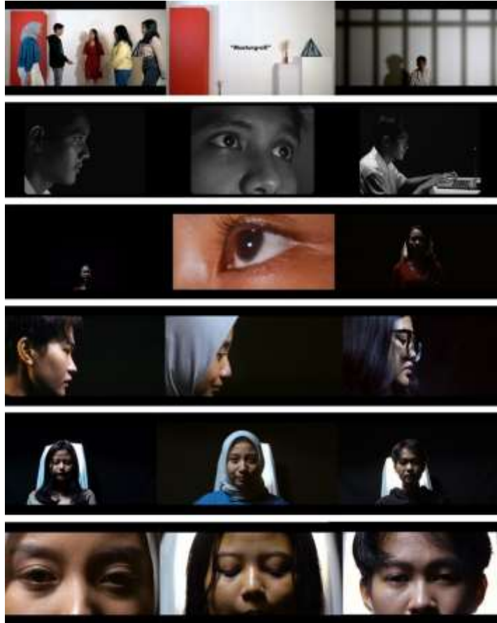
Gambar 5.1. Media Utama

Media : Digital Elektronik Durasi : 00:02:21 Ukuran : 2720 x 1530 Px Format : Mp4 Tipografi : FUTURA & POSTER GOTHIC Karya : Adobe Premiere Pro, Adobe Photoshop Tema : Kekerasan Seksual Realisasi : Video Iklan Layanan Masyarakat Genre : Fiksi