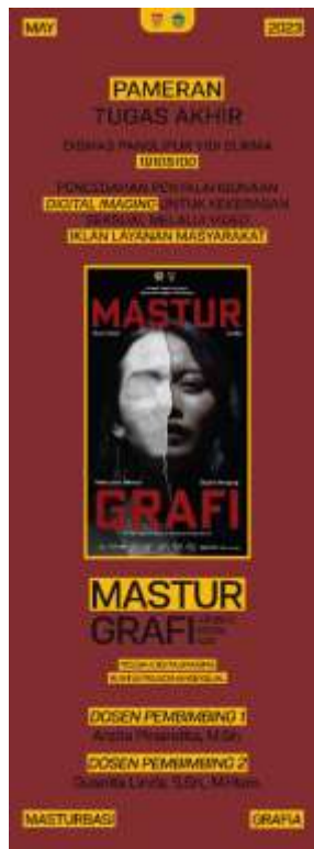
Gambar 5.7. Xbanner