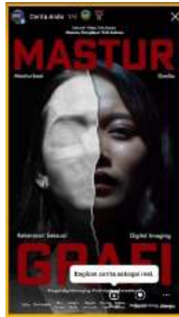
Gambar 5.6. Story Instagram