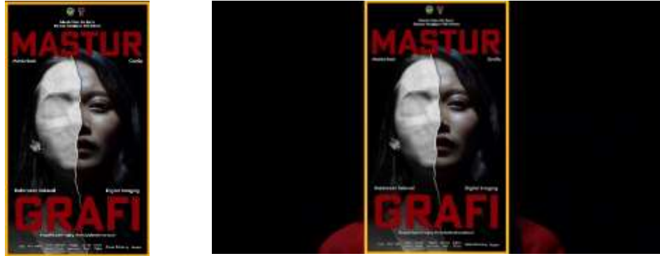
Gambar 5.3. Poster