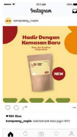
Gambar 5. 19 Feed Instagram