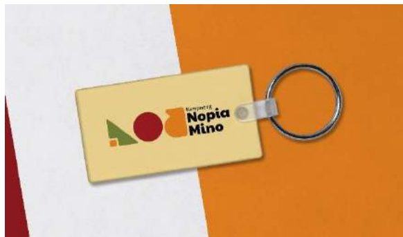
Gambar 5. 13 Keychain

Penempatan : Merchandise Kampoeng Nopia Mino Media : Akrilik Ukuran : 3 cm x 7 cm Visual : Logo Tipografi : Paytone dan Mukta