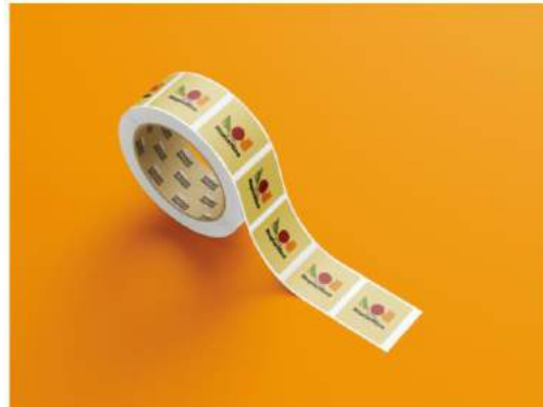
Gambar 5. 14 Stiker

Penempatan : Merchandise Kampoeng Nopia Mino Media : Cetak Ukuran : 4 cm x 7 cm Visual : Logo Tipografi : Paytone dan Mukta