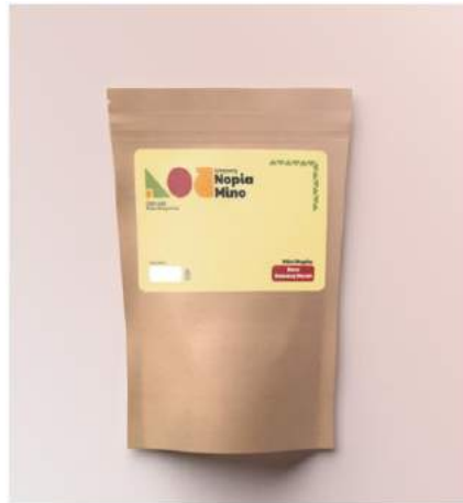
Gambar 5. 10 Kemasan

Penempatan : Etalase Aula Kampoeng Nopia Mino Media : Cetak Ukuran : 21,5 cm x 14 cm Visual : Logo, supergrafis Tipografi : Paytone dan Mukta