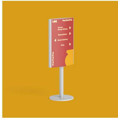
Gambar 5. 6 Wayfinding