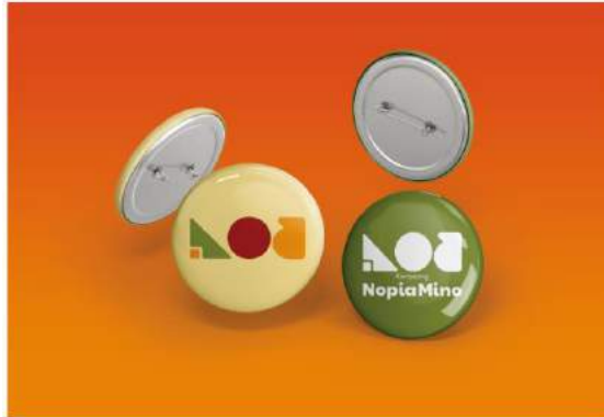
Gambar 5. 12 Pin Button

Penempatan : Merchandise Kampoeng Nopia Mino Media : Cetak Ukuran : 4,4 cm x 4,4 cm Visual : Logo Tipografi : Paytone dan Mukta