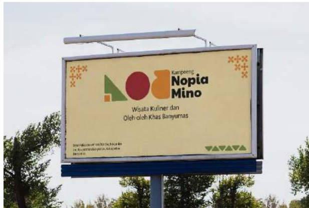
Gambar 5. 4 Baliho