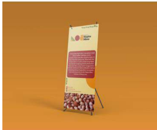
Gambar 5. 5 X Banner