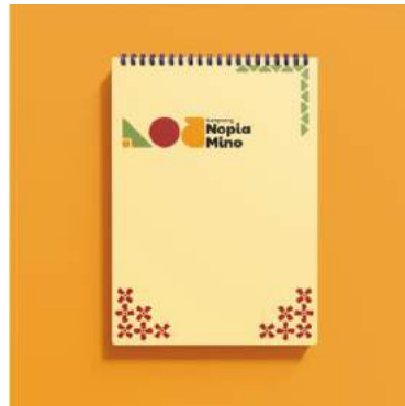
Gambar 5. 18 Notebook