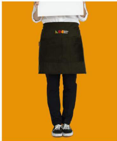
Gambar 5. 9 Apron