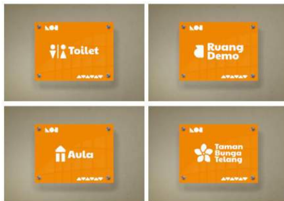
Gambar 5. 7 Signage