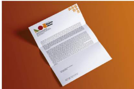
Gambar 5. 16 Kop Surat