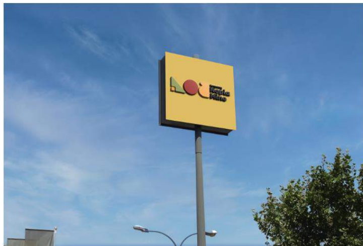
Gambar 5. 3 Papan Plang Nama