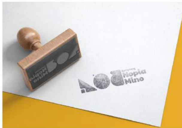
Gambar 5. 15 Stampel

Penempatan : Dokumen Kampoeng Nopia Mino Ukuran : 3,8cm x 8cm Media : Cetak Visual : Logo Tipografi : Paytone dan Mukta