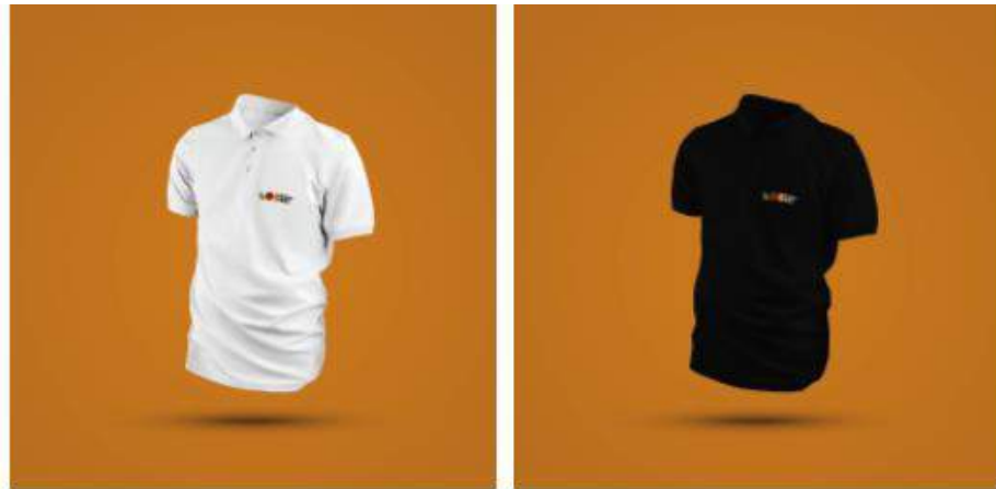
Gambar 5. 8 Kaos Polo