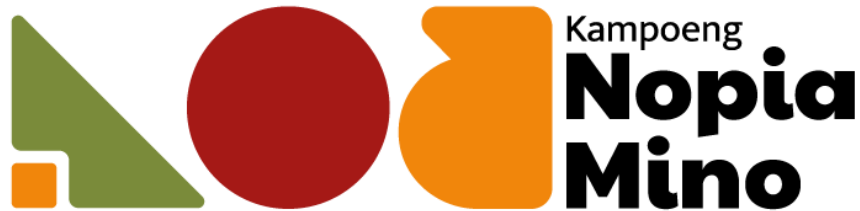
Gambar 5. 1 Final Logo