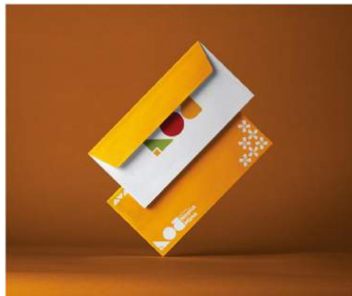
Gambar 5. 17 Amplop