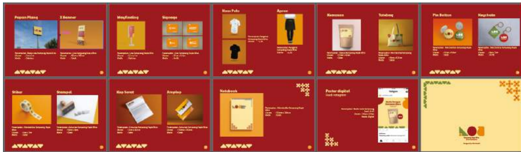
Gambar 5. 2 Brand Guideline