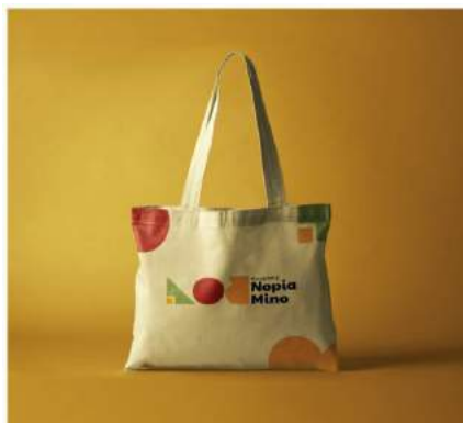
Gambar 5. 11 Totebag

Penempatan : Etalase aula Kampoeng Nopia Mino Media : Cetak