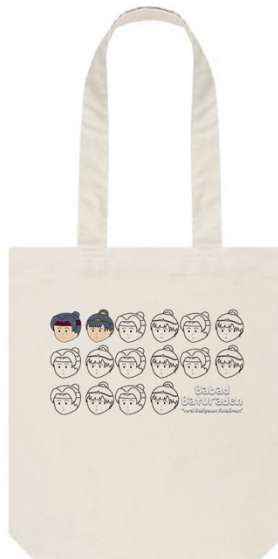
Gambar 5. 15 Desain totebag

Media : Totebag Canvas Ukuran : 38x40cm Tipografi : Boleh fnt, Sunny Sunday font