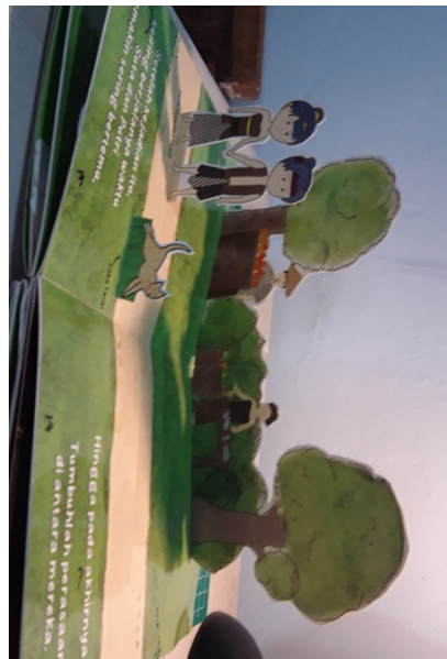
Gambar 5. 6 Halaman 3 buku pop up