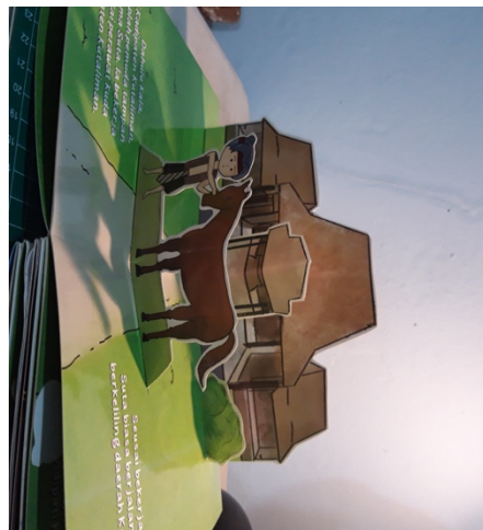
Gambar 5. 4 Halaman 1 buku pop up

Media : Kertas Ivory 310 gr Ukuran : A5 Tipografi : Sunny Sunday font