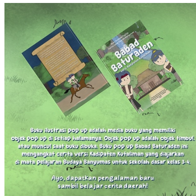
Gambar 5. 12 Desain konten sosial media 2

Tipografi : Boleh font, Sunny Sunday font