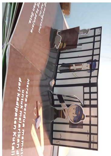
Gambar 5. 8 Halaman 5 buku pop up