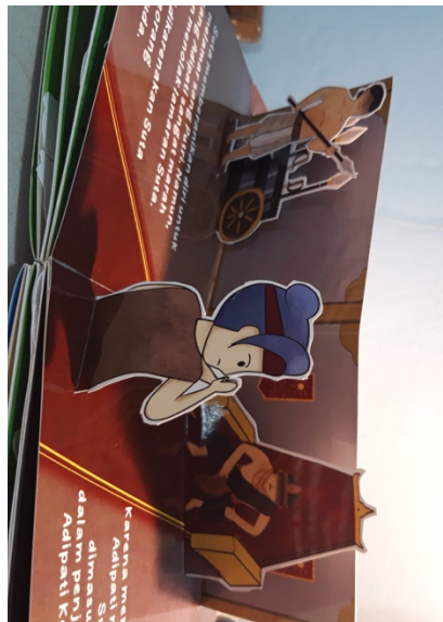
Gambar 5. 7 Halaman 4 buku pop up