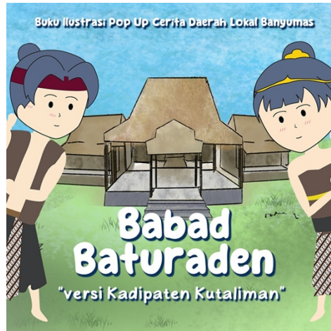
Gambar 5. 11 Desain konten sosial media 1 (Sumber: Hasil desain perancang)