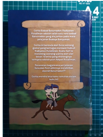
Gambar 5. 3 Sampul belakang buku