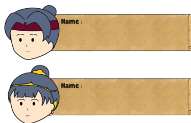
Gambar 5. 16 Desain stiker nama