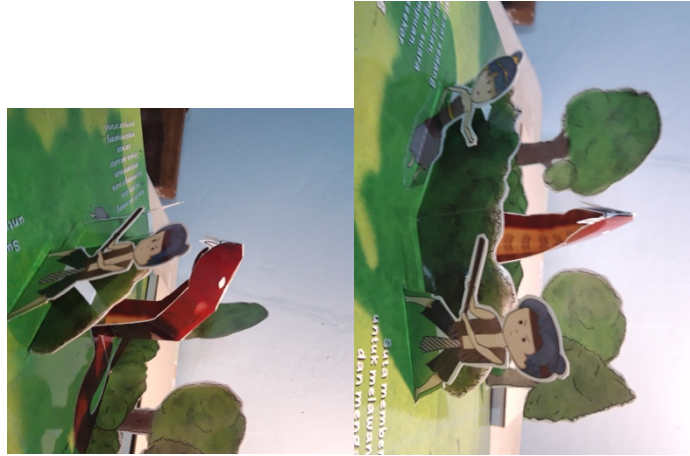
Gambar 5. 5 Halaman 2 buku pop up