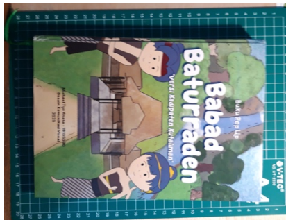
Gambar 5. 2 Sampul depan buku