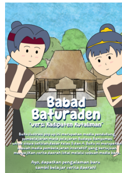
Gambar 5. 14 Desain poster A3

Media : Kertas Art Paper 150gr Ukuran : A3 Tipografi : Boleh font, Sunny Sunday font