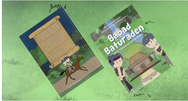
Gambar 5. 1 Mockup buku pop up (Sumber: Hasil desain penulis)