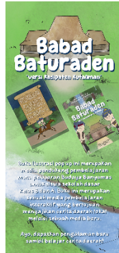
Gambar 5. 13 Desain mockup flyer

Media : Kertas Art Paper 120gr Ukuran : 9.9cmx21cm Tipografi : Boleh font, Sunny Sunday font