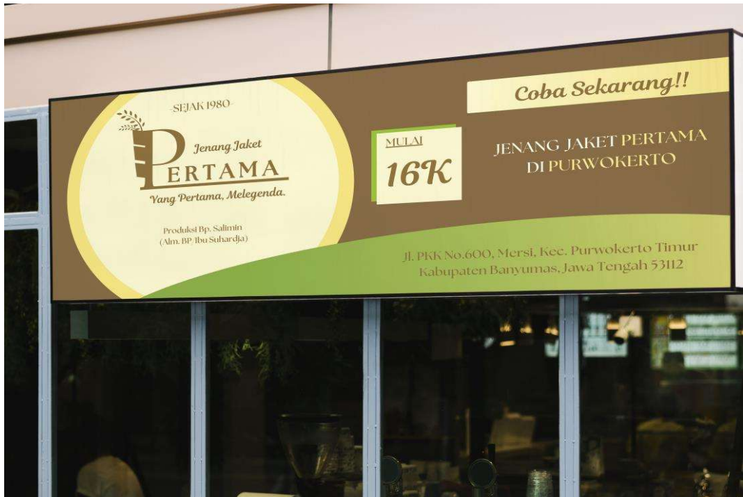
Gambar 5. 6 Banner Jenang Jacket Pertama