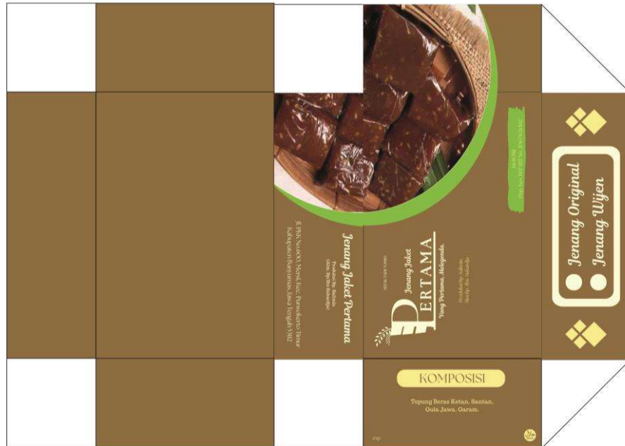
Gambar 5. 8 Packaging Jenang Jaket Pertama