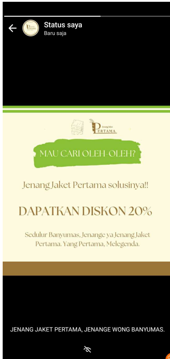
Gambar 5. 5 Postingan WA Jenang Jaket Pertama