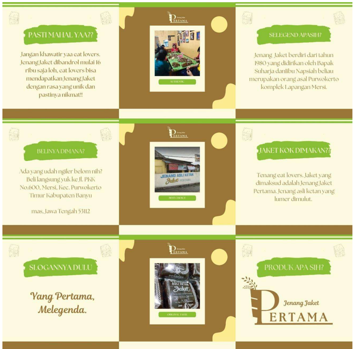
Gambar 5. 3 Feed Instagram Jenang Jacket Pertama