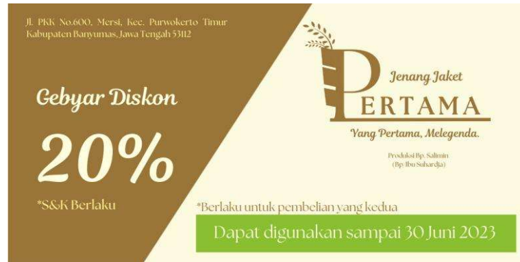
Gambar 5. 9 Voucher Diskon Jenang Jacket Pertama

Media : Art Paper 230gr Penempatan : Depan Toko Ukuran : 10 x 5 cm Tipografi : Romman, The Seasons Visualisasi : Adobe Illustrator CS5 2010