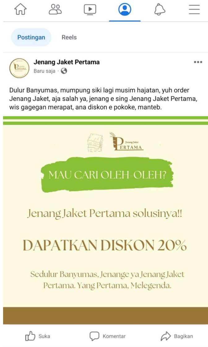
Gambar 5. 4 Postingan Facebook Jenang Jacket Pertama