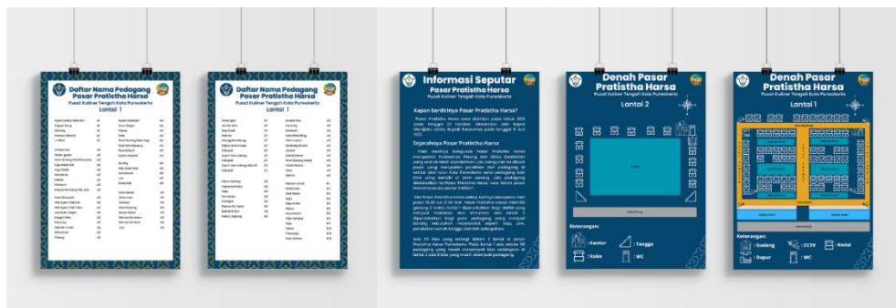
Gambar 5. 10 Mock Up Infografis

Penempatan : Pedagang di pasar Pratistha Harsa Ukuran : A4 Visual : Logo pasar, logo Pemerintah, tipografi, supergraphic dan gambar vektor Tipografi : La Barokah Regular dan Poppins