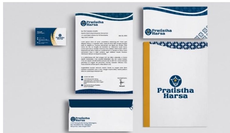
Gambar 5. 16 Kartu Nama

Penempatan : Kantor Pengelola Pasar Visual : Supergraphic , Logo, Tipografi, Logo ikon Tipografi : Poppins Ukuran : 9 x 5,5 cm