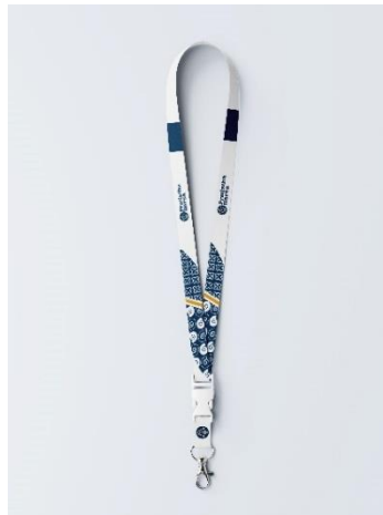
Gambar 5. 21 Lanyard

Penempatan : Kantor Pengelola Pasar dan Pegang Pasar