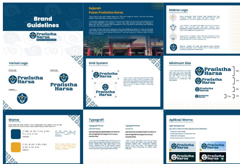
Gambar 5. 2 Brand Guidelines Sumber Data peneliti