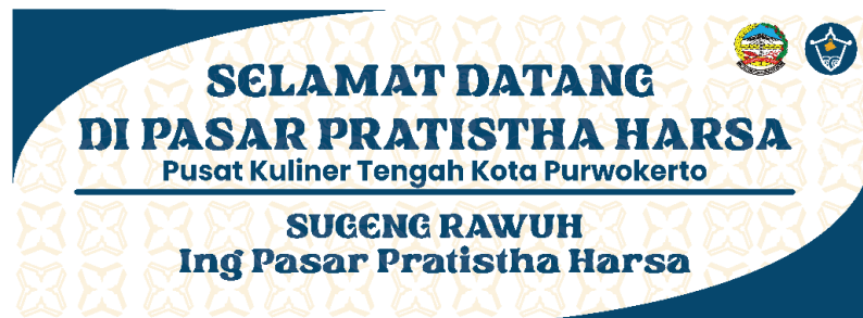
Gambar 5. 6 Desain Banner