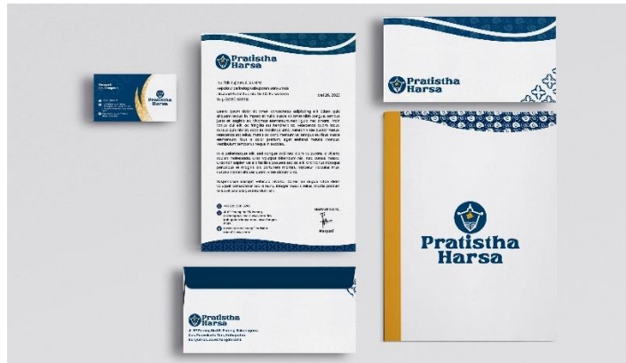
Gambar 5. 13 Kop Surat