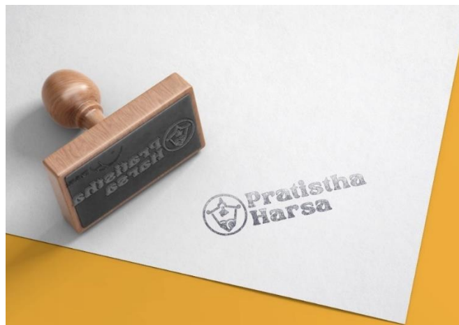
Gambar 5. 12 Stempel