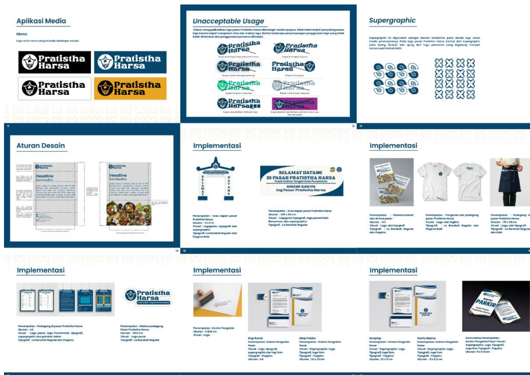
Gambar 5. 3 Brand Guidelines