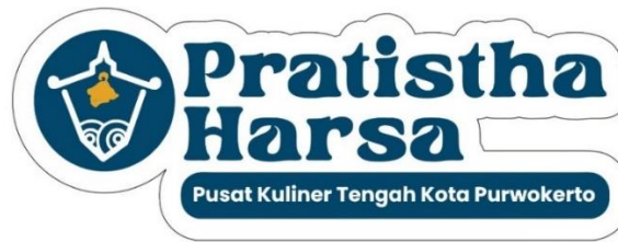
Gambar 5. 11 Stiker