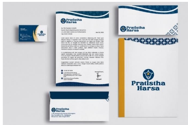
Gambar 5. 15 Amplop Sumber Data peneliti

Penempatan : Kantor Pengelola Pasar Visual : Supergraphic , Logo, Tipografi, Logo ikon Tipografi : Poppins Ukuran : 23 x 11 cm