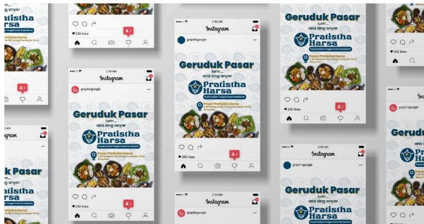
Gambar 5. 22 Poster Sosial Media