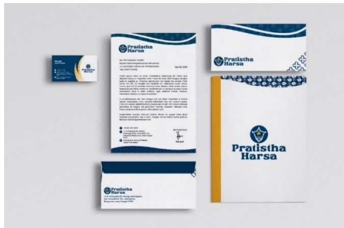
Gambar 5. 14 Map Folder