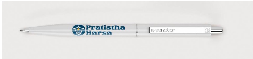
Gambar 5. 18 Pulpen