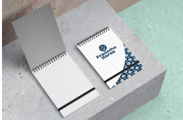
Gambar 5. 19 Notebook

Penempatan : Kantor Pengelola Pasar Visual : Logo, supergraphic dan tagline Tipografi : La Barokah Regular dan Poppins Ukuran : A6