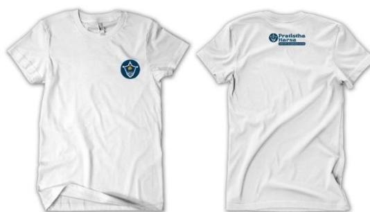
Gambar 5. 8 Mock Up Kaos Pengelola dan Pedagang