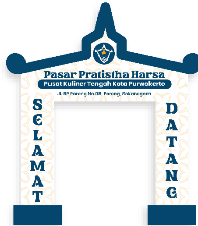
Gambar 5. 5 Gapura