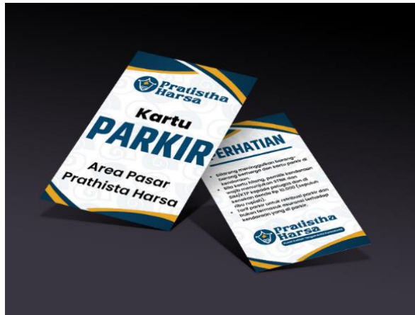
Gambar 5. 17 Kartu Parkir