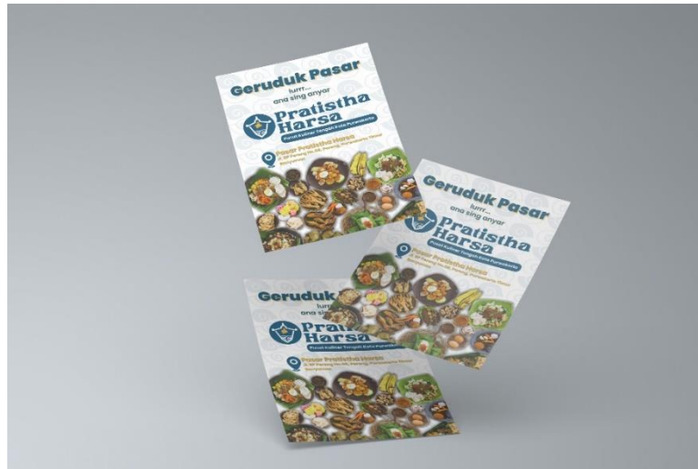
Gambar 5. 7 Poster