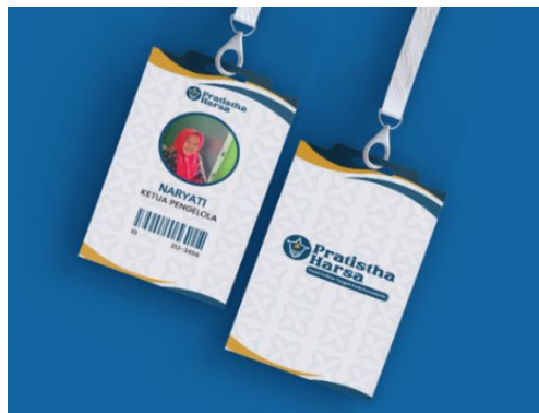
Gambar 5. 20 ID Card

Penempatan : Kantor Pengelola Pasar dan Pedagang Pasar Visual : Supergraphic , Logo, Tipografi, Logo ikon Tipografi : Poppins Ukuran : 4,8x8 cm