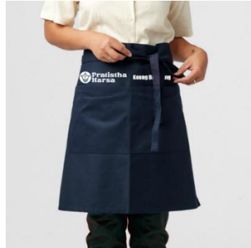
Gambar 5. 9 Mock Up Apron

Penempatan : Pedagang di pasar Pratistha Harsa Ukuran : 70 x 48 cm Visual : Logo, dan tipografi Tipografi : La Barokah Regular dan Bold