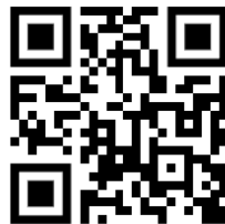
Gambar 5. 3 QR Akses Video Pengenalan