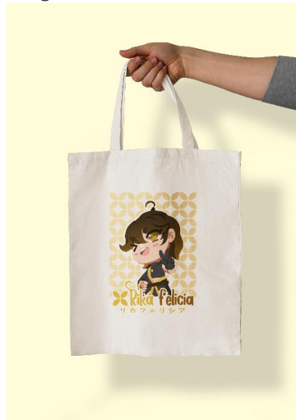
Gambar 5. 8 Desain Totebag