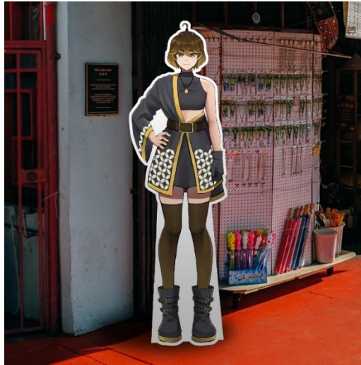
Gambar 5. 10 Desain Stand Karakter