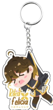
Gambar 5. 5 Desain Gantungan Kunci