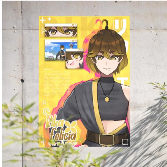
Gambar 5. 9 Desain Poster

Ukuran poster : A3 29,7 x 42 cm Media : Cetak Visualisai Karya : Clip Studio Paint, Photoshop