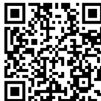
Gambar 5. 14 QR Akses Video Shoert/Reels 2