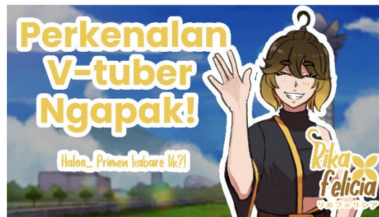
Gambar 5. 2 Video Perkenalan