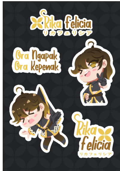
Gambar 5. 6 Desain Stiker