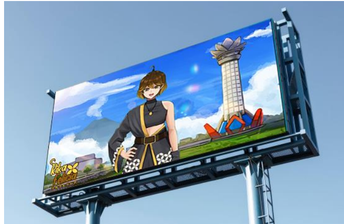
Gambar 5. 4 Iklan Videotron