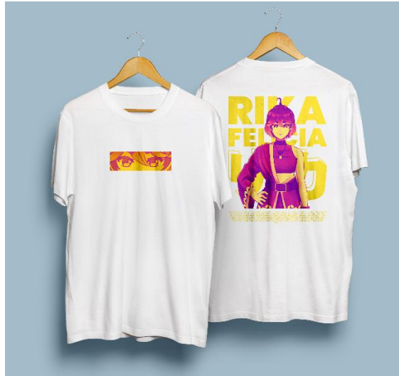
Gambar 5. 7 Desain kaos