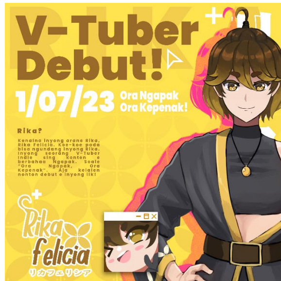
Gambar 5. 15 Desain Iklan Poster Digital

Ukuran Poster : 2480x2480 pixel Media : Internet Visualisai Karya : Clip Studio Paint, Photoshop