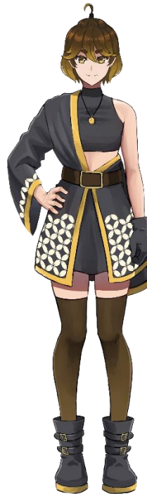
Gambar 5. 1 Karakter Rika Felicia

Media utama yang digunakan dalam perancangan ini adalah karakter Virtual Youtuber yang dikenalkan melalui sebuah video perkenalan.