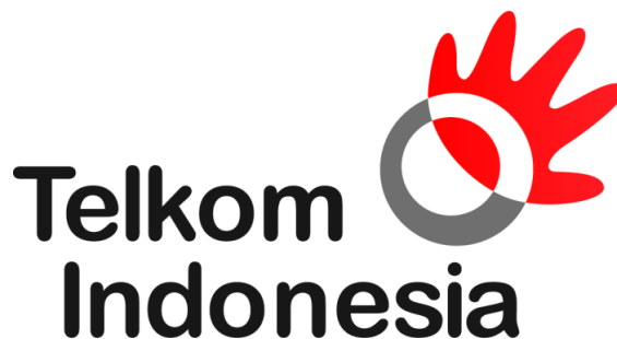
Gambar 1. 1 Logo Identitas PT. Telkom Indonesia