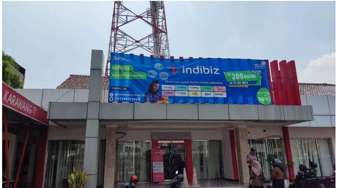
Gambar 2.5 Gedung Lokasi Pelaksanaan KP