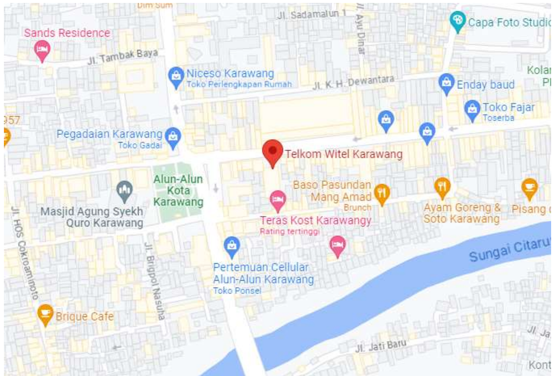
Gambar 2.4 Peta Lokasi Kerja Praktik

Lokasi pelaksanaan Kerja Praktik penulis adalah di PT. Telekomunikasi Indonesia ( Telkom ) Area Kabupaten Karawang Divisi Regional III Jawa Barat, tepatnya Jl. Tuparev No.24, Nagasari, Kec. Karawang Barat, Karawang, Jawa Barat 41312. Berikut adalah foto lokasi Kerja Praktik jika dilihat dari Google Maps dan foto lokasi kerja.