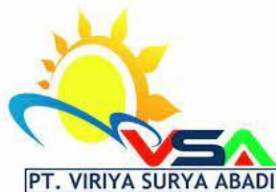
Gambar 1. 1 Logo PT Viriya Surya Abadi