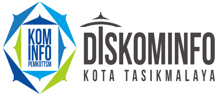
Gambar 1.1 logo Dinas Komunikasi dan Informatika Kota Tasikmalaya.

Dinas Komunikasi dan Informatika (Diskominfo) adalah lembaga pemerintahan di Indonesia yang bertanggung jawab atas pengelolaan dan pengembangan sektor komunikasi dan informatika di tingkat daerah. Diskominfo berperan penting dalam menyediakan layanan informasi, mengatur teknologi informasi dan komunikasi, serta mempromosikan perkembangan teknologi di daerahnya [2].