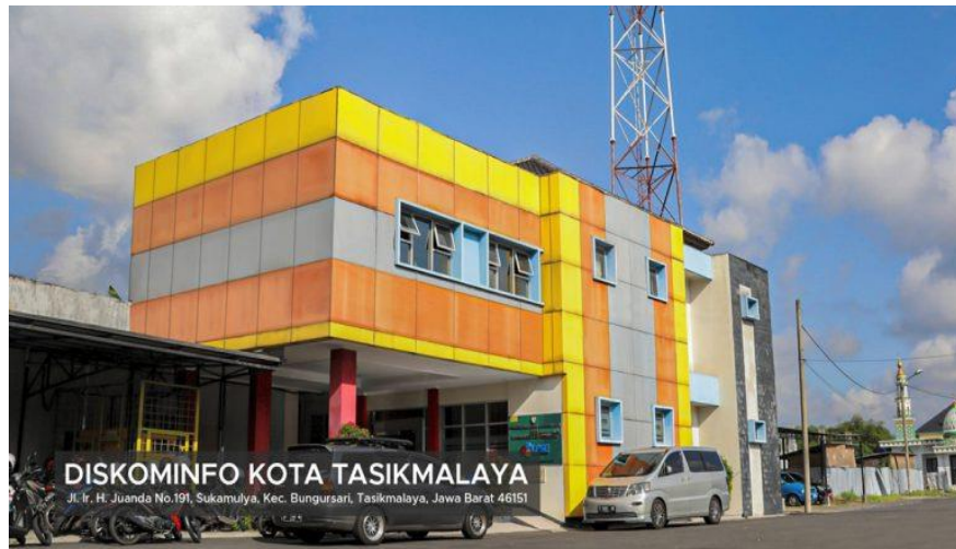
Gambar 1.3 Gedung Lokasi Tempat Kerja Praktik

Lokasi Tempat Kerja Praktik berada di Dinas Komunikasi dan Informatika Kota Tasikmalaya, Tepatnya Jl. Ir. H. Juanda No.191, Sukamulya, Bungursari Tasikmalaya, Jawa Barat 46151.