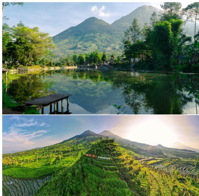
Gambar 4. 1 Fotografi Landscape

Gaya foto merupakan acuan atau pedoman untuk mengelola foto yang akan diabadikan agar dalam pembuatan buku katalog bisa diterapkan secara konsisten. Untuk gaya yang ingin disajikan penulis adalah menggunakan pengambilan konsep landscape yang bertujuan untuk memperlihatkan secara luas keindahan wisata tersebut.