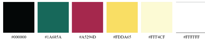
Gambar 4. 6 Konsep Warna