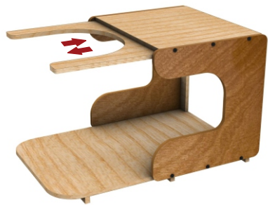
Kondisi meja terapi saat digunakan (saat dibuka terdapat sistem pengunci otomatis)