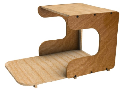
Prototype Meja Terapi Autis