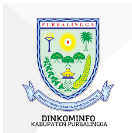
Gambar 1.1 Logo Dinkominfo Purbalingga