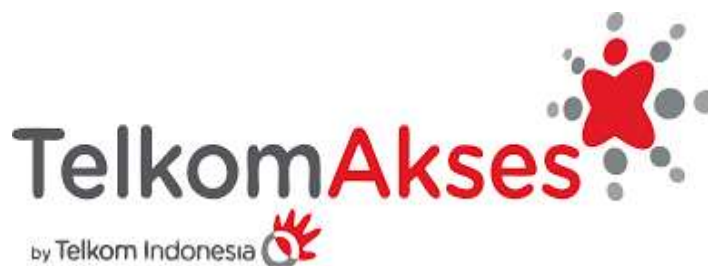
Gambar 1. 1 Logo Telkom Akses

PT. Telkom Akses (PTTA) merupakan salah satu anak perusahaan PT. Telkom Indonesia, Tbk yang bergerak di bidang konstruksi pembangunan dan magane layanan infrastruktur jaringan. PT. Telkom Akses di dirikan pada tanggal 12 Desember 2012. Saham PTTA sepenuhnya merupakan hak milik Telkom akses. Pendirian PTTA merupakan bentuk komitmen Telkom untuk terus melakukan pengembangan pelayanan jaringan broadband untuk menghadirkan akses infromasi dan komunikasi tanpa batas bagi seluruh masyarakat Indonesia.