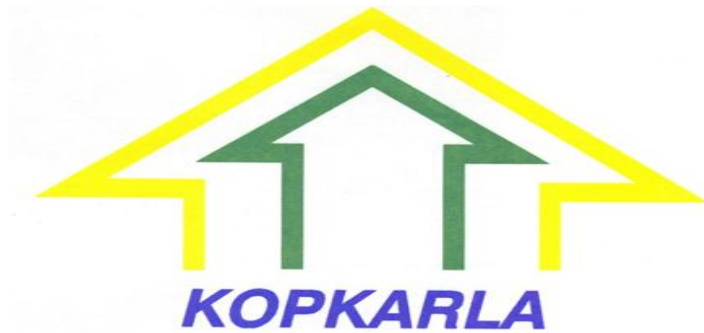
Gambar 1.1 Logo Koperasi Karyawan PT. Aplikanusa Lintasarta